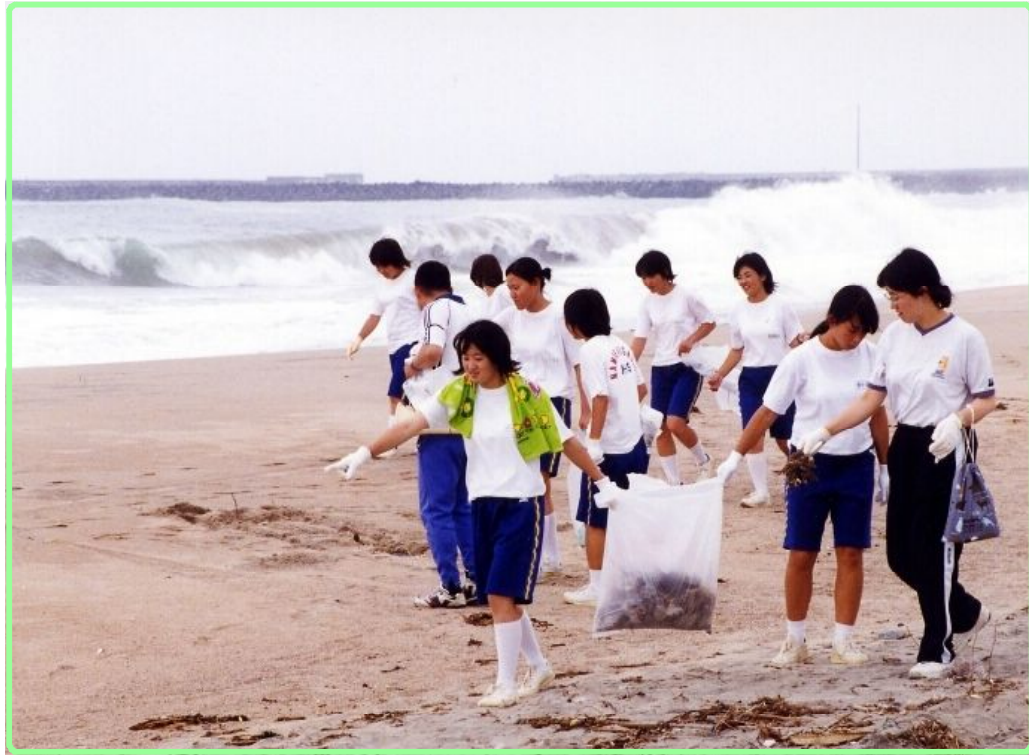
← 海岸をきれいにする活動

海とともに生活する人びとにとっては、海のごみは生活に大きなえいきょうをあたえます。夏になると、町内にある海岸に多くの海水浴客がおとずれ、ゴミも出ます。ですから、海岸をきれいにしたり、サケがもどってくる川をきれいにしたりする活動もおこなっています。