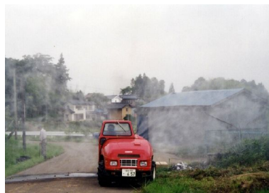
しょうどく スピードスプレーでさんぶします。