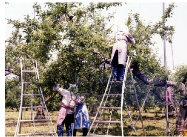
てき花・てき果 大きな実にするため、花や実の数をへらします。