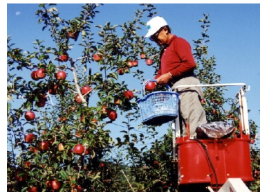
とりいれ 赤く実ったものから取りれていきます。