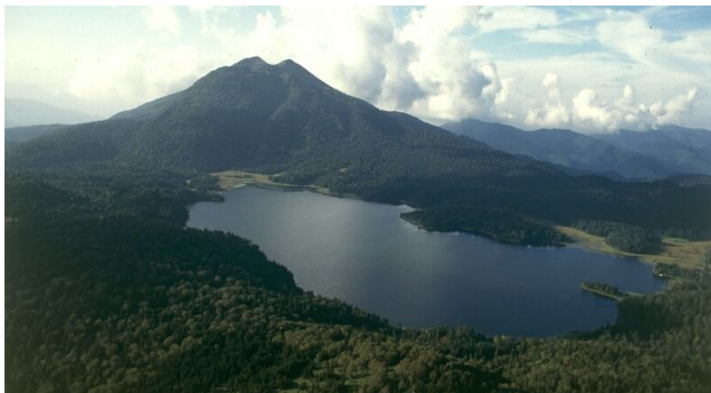
介 尾瀬沼と燧ヶ岳 (標高2356m)