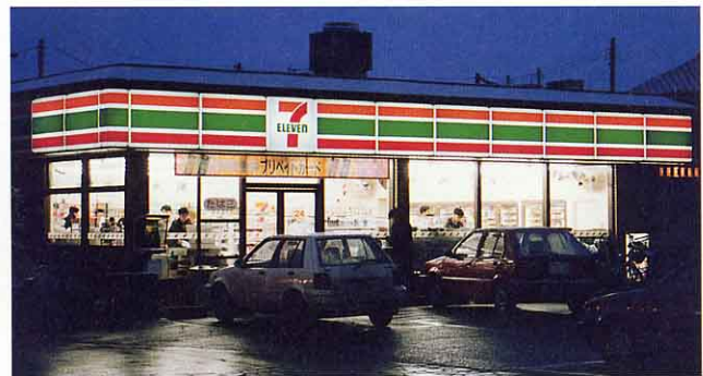
▲コンビニエンスストア（セブンイレブン）