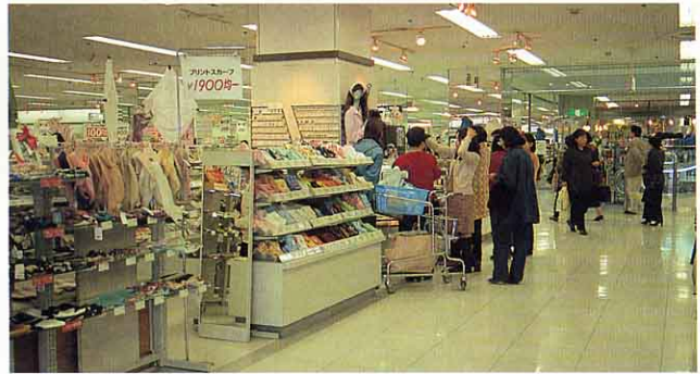
▲イトーヨーカドー（店内）