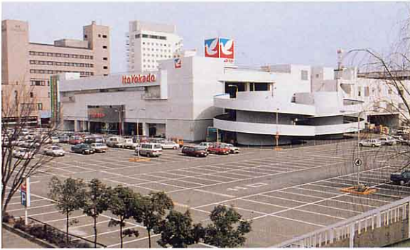
▲イトーヨーカドー（福島店）