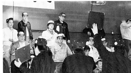
▲市場のせりのようす