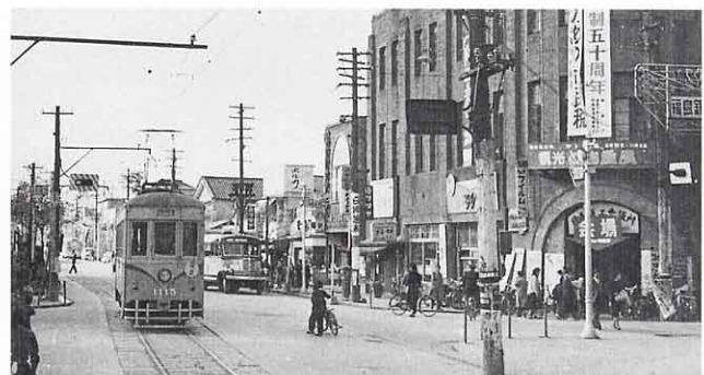
▲ 1957年ころの駅前通りとバセオ通りの交差点（昭和32年）