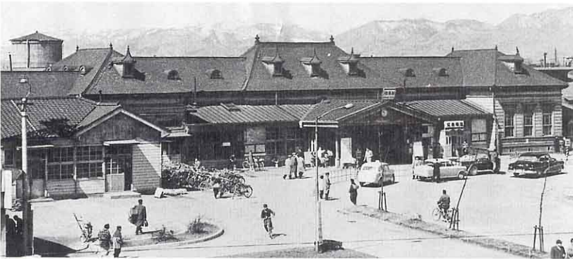
▲ 1955年ころの福島駅（昭和30年ころ）