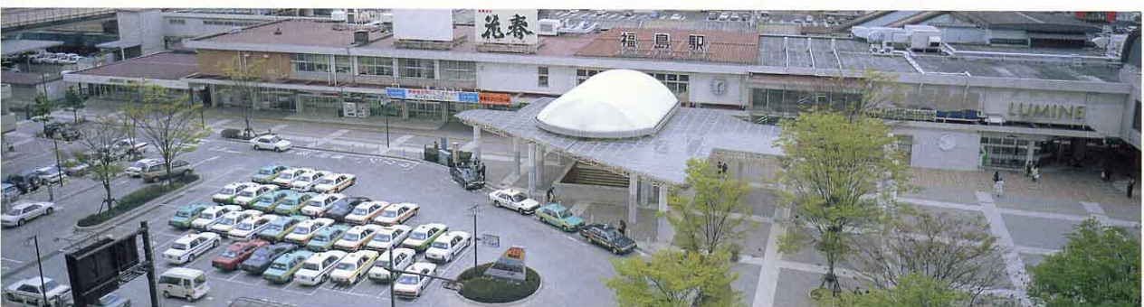
▲ 福島駅東口（平成9年）