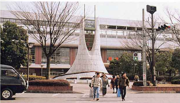
▲ 福島駅西口（平成8年）