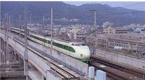
▲ 1982年東北新かん線開通（昭和57年）