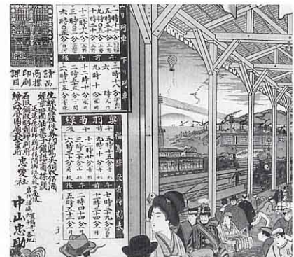
▲ 1900年の福島駅の時こくひょう（明治33年）