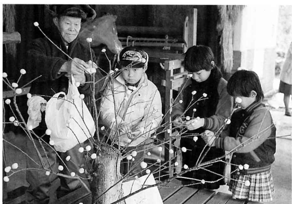
▲だんごさし (市・民家園 1月14・15日)