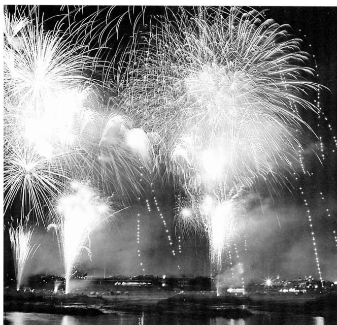
▲花火大会 (7月末~8月始め)