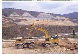
▲ ダムの底のせい地と国道の整備がすすむ