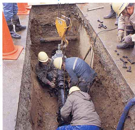
▲ 太いパイプをうめる水道工事