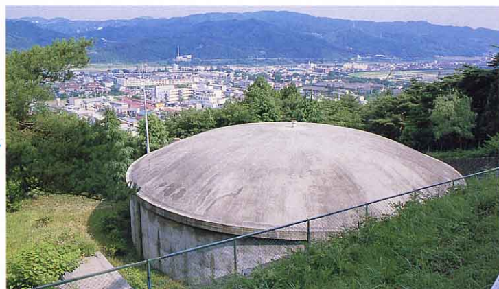
▲ 山神配水池(岩谷かんのん付近)