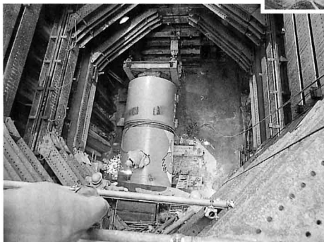
▲ 地下で下水道をほる（県庁前）