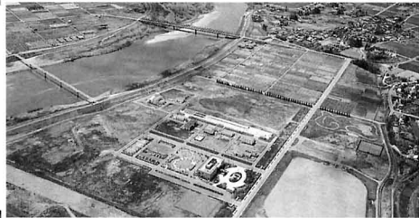
◀ 県北浄化センター（国見町）