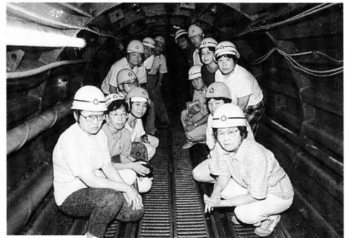
▲ 市内の先生もトンネルを見学（伊達町）