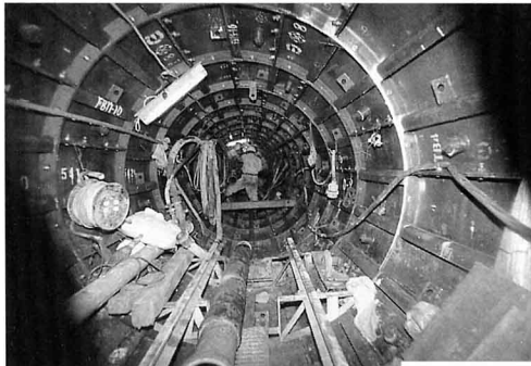
▲ 地下を掘りすすむ下水道（福島市）

よごれた下水で阿武隈川をよごさないように、流域の市や町が協力して、下水道の建設をすすめ、一部は使われています。