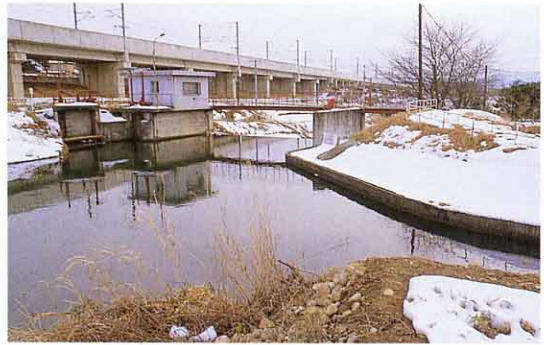
▲産が沢のうかい(芝堤) ④