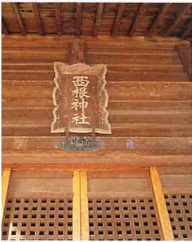
▲二人は西根神社にまつられています。①