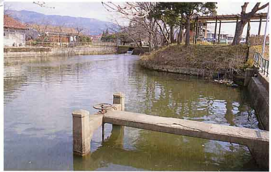
▲ため池(藤田観月台公園) ⑤