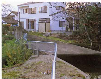
▲明神のといごし(湯野) ②