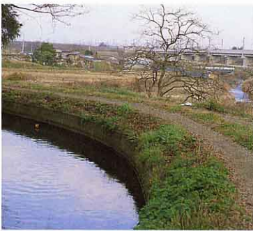
▲今の西根ぜき(産ヶ沢右岸) ④