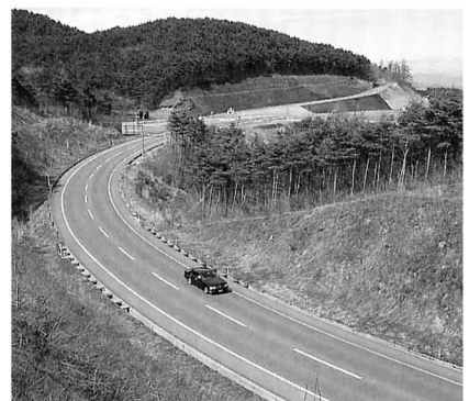
▲ ゆるくなったカーブ