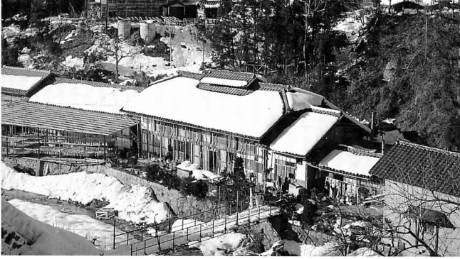
▲ 冬の夜はひえこむ立子山のようす

気温がさがるのを利用して、凍豆腐 しみ豆腐 をつくっています。機械づくりも多くなってきました。