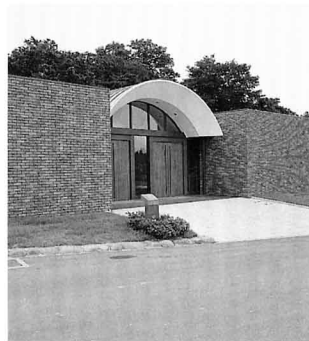
▲ 製作体験ができる工芸館 人気の「四季の里」