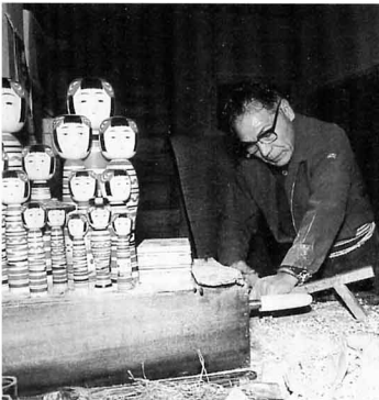
▲ こけしをつくっているようす

全国的に有名な土湯のこけしづくりは、木のわんなどをつくっていた木地師 きしし から引きつがれました。