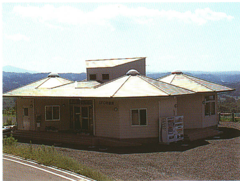
UFO物産館 町の特産品を展示即売し、レストランでは軽食も。UFOふれあい館の向かい側。

さらに町では、歴史・文化遺産とも併せて、より多くの方々が参加し、交流し、学習できる施設の整備にも取り組み、多彩な魅力を持った観光地の形成に力を入れています。