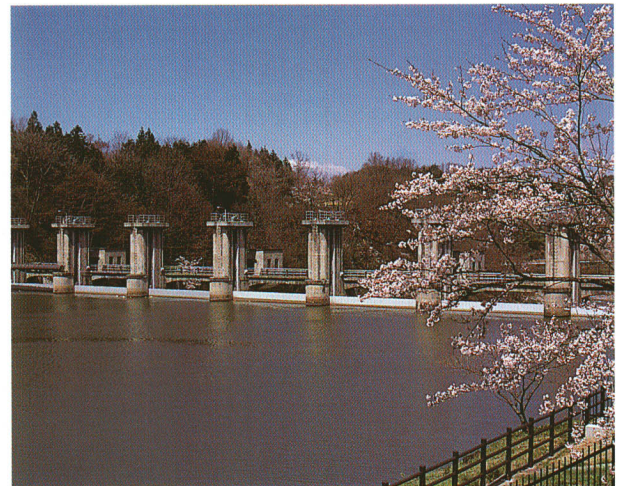
堰堤公園 戦前に造られた町民の憩いの場。春は桜の名所として多くの花見客で賑わいます。