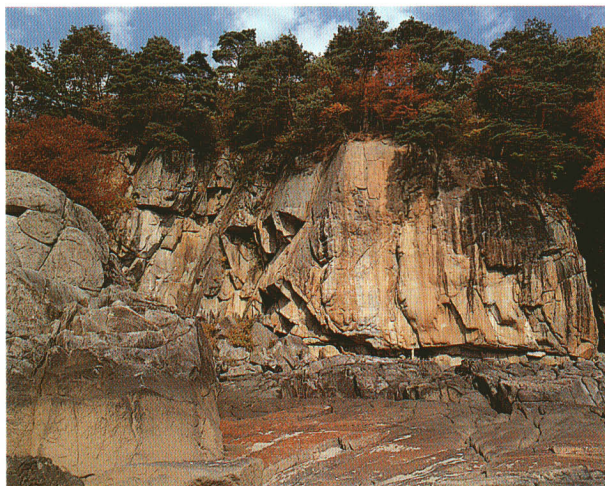
大日岩 阿武隈川沿いの断崖が迫力ある溪谷美を生み出しています。県名勝天然記念物指定。