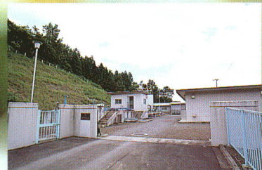
整備された浄水場