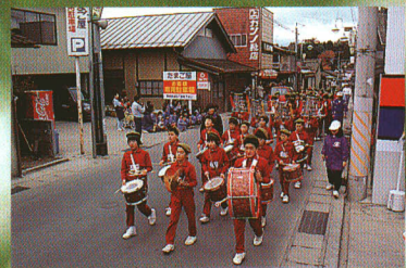
小学生による交通安全パレード