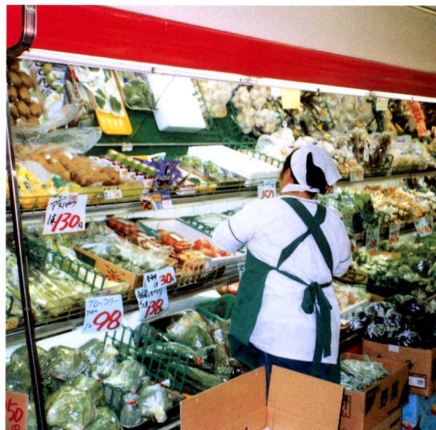
▲しなものをならべる