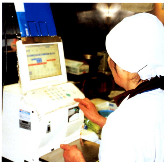
▲バーコードラベルをつくる