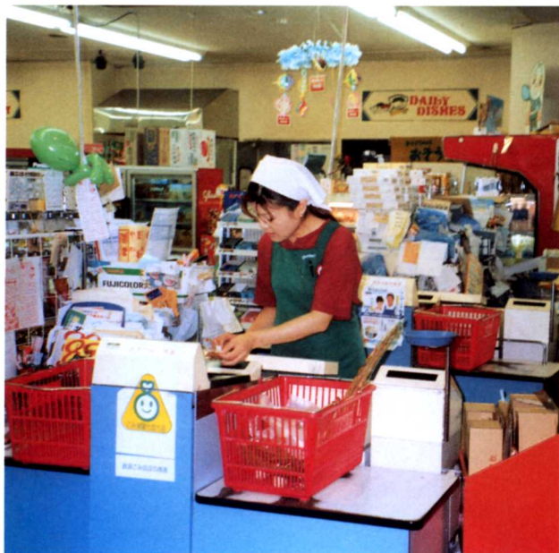
かいけい ▲会計をする