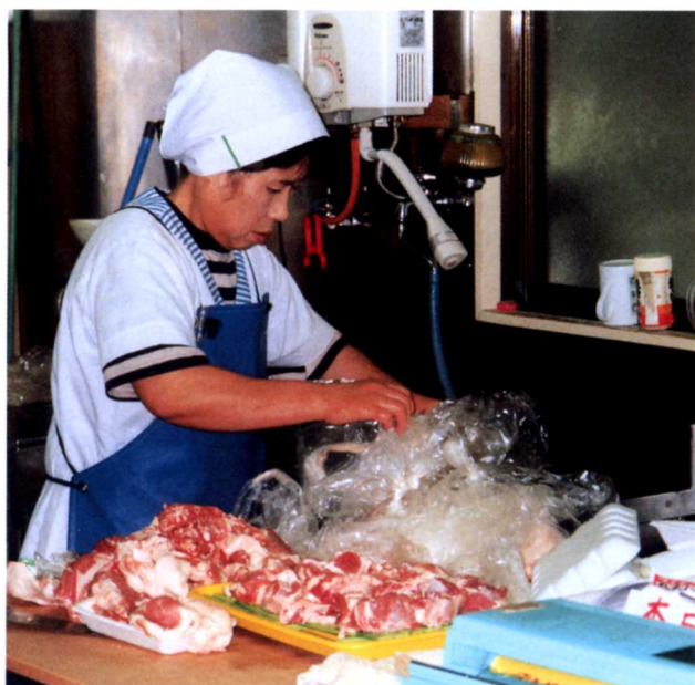
▲トレーに肉を入れる