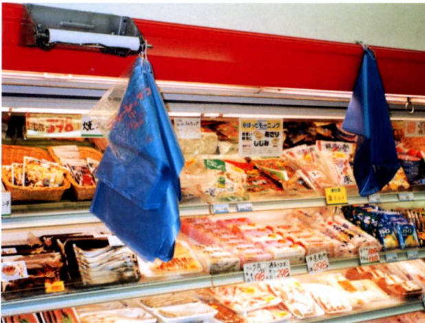
▲袋を自由に使ってもらえるように