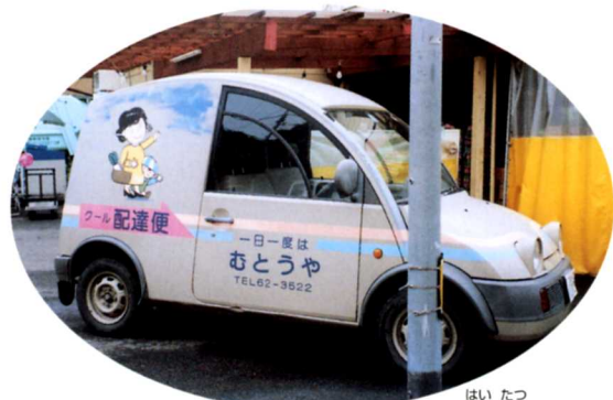
▲配達につかう自動車