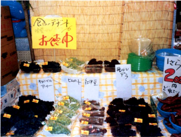
▲特売品を目立つように