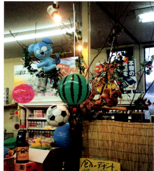
▲きせつにあったかざりつけ