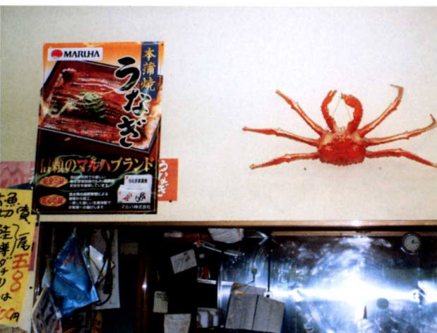
▲何売り場かわかりやすく