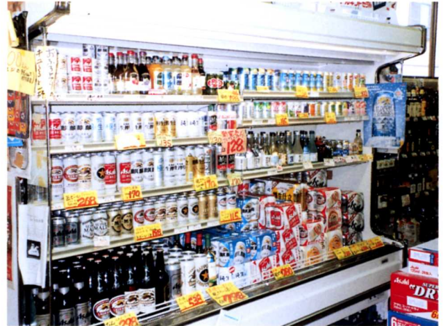
▲ねだんがわかりやすく