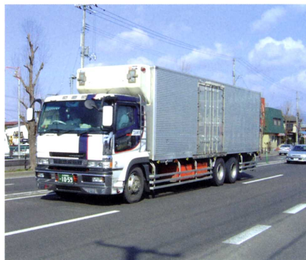
▲いろいろな地いきへ