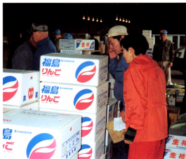
▲りんごをせりにかける(二本松青果市場)