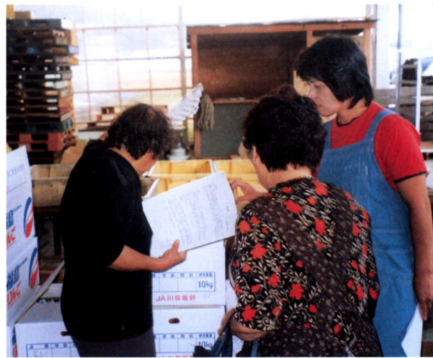
▲品質をけんさする