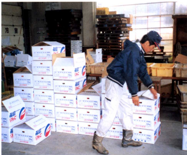
▲JAにりんごをはこぶ(JA川俣飯野本店)