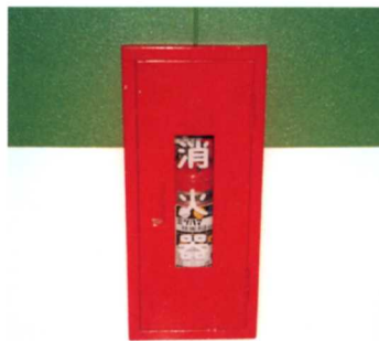
▲ しょう 消火き