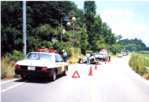
▲交通事故のしより