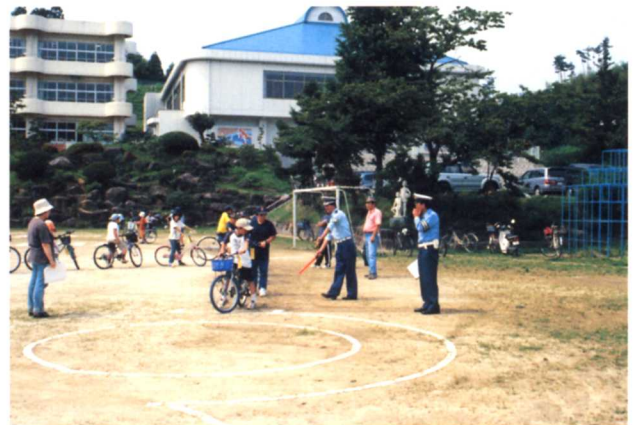
▲交通安全教室で指導