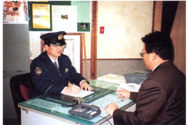
▲落とし物うけつけ