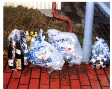
▲収集所のごみ (もえないもの)