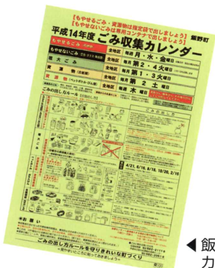
◀飯野町ごみ収集カレンダー