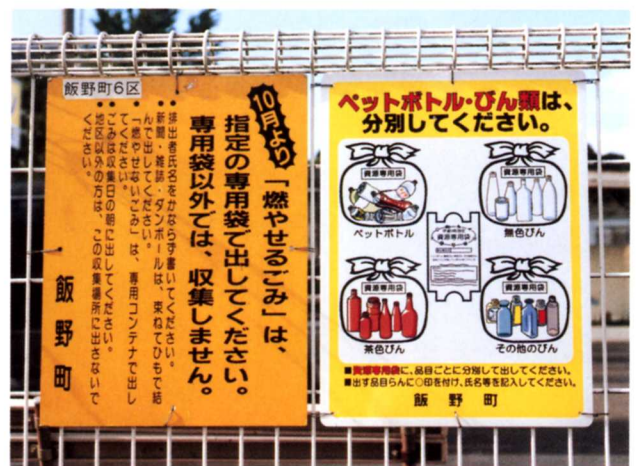
▲ごみ収集場所のひょうじばん