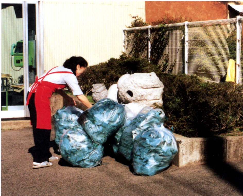
しゅうじゅうじょ ▲収集所へごみ出し