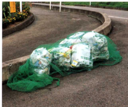
▲収集所のごみ (もえるもの)