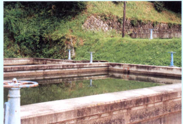
ちんでんち ▲沈澱池