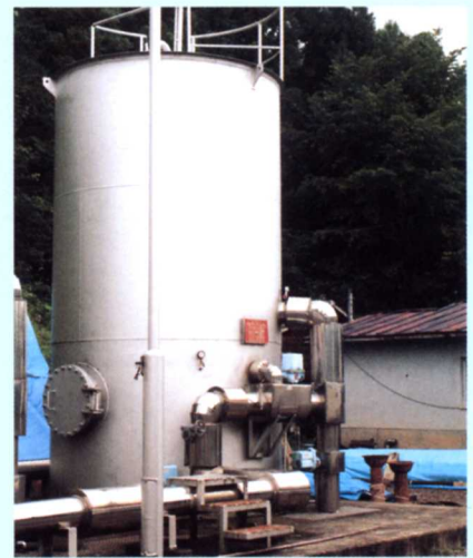
ちよすい ▲貯水タンク