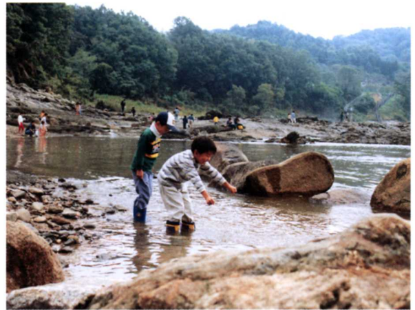
▲飯野堰堤下流（水辺の楽校）