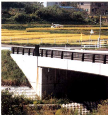
▲小平のあたりのようす