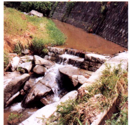
▲境川からの取り入れ口