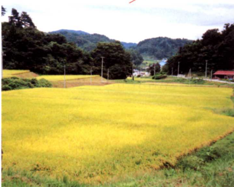
▲源田内のあたりのようす