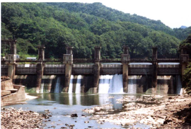
▲蓬萊ダム(飯野堰堤)