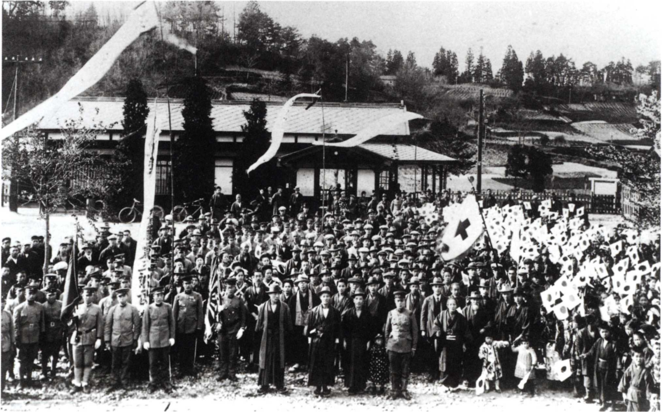
▲川俣線開通記念(1926年) 川俣町と松川町を結んでいました。