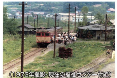
(1972年撮影・現在の福祉センター付近)