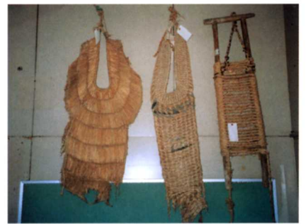
▲みの・ねこみの・やせうま