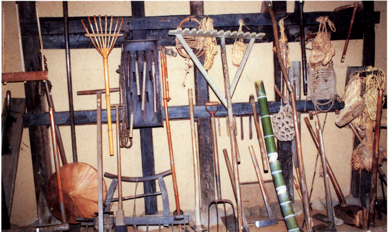
のうくおさば ▲農具置場のようす