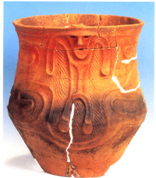
じんたいもんどき ▲人体文土器

約4500年前の家のあとであることが分かっています。屋根は元のすがたを想像してつくられています。