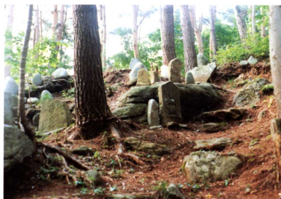
いわつかごうしんづか ▲岩塚庚申塚(青木字岩塚)

なくなった人の幸せをいのるために建てられたものです。約200年前に建てられました。