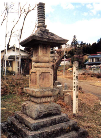
ほうきょういんとう にしかじごううち ▲宝篋印塔(明治字西鍛冶合内)

なくなった人の幸せをいのるために建てられたものです。約200年前に建てられました。