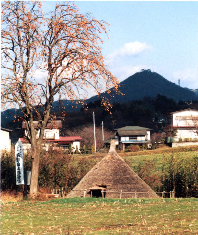
はくざんじゆうきよあと けんしせきしてい ▲白山住居跡(県史跡指定)(飯野字白山)

約4500年前の家のあとであることが分かっています。屋根は元のすがたを想像してつくられています。