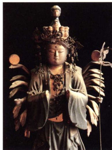
ぶつ ぞう ▲五大院の仏像(飯野字町)

この仏像は、つくられた 年代や作者はわかりません。 五大院にはそのほかたくさ んの像があります。