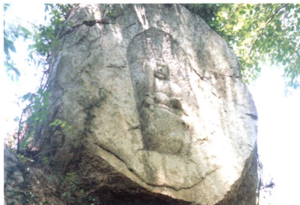
ちやうし くち まが いぶつ ▲銚子口磨崖仏(飯野字長畑)