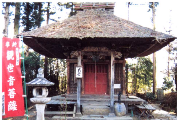
たいけいじ かのんのどう ▲大桂寺の観音堂(大久保字普門)