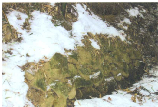
いし がき ▲今も残る箱屋館の石垣