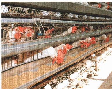
▲にわとり・たまご