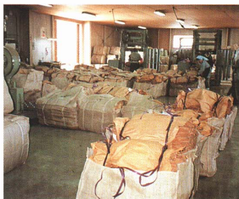
▲JT葉たばこ取りあつかい所（山木屋）で、葉を選別する。選ばれた葉は圧縮されて原料工場へ運ばれる。