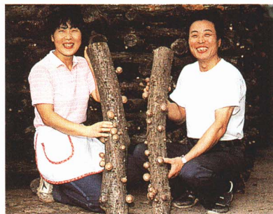
▲しいたけさいばい