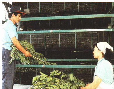
▲か い こ