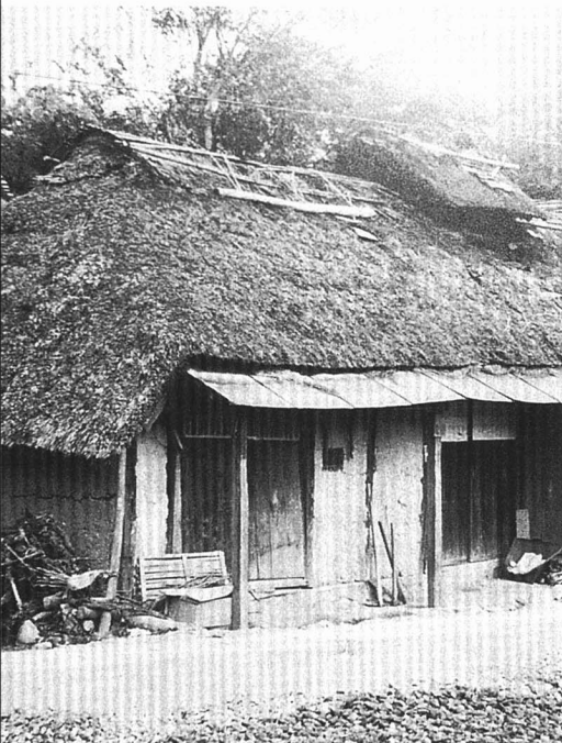
▲昔の農家（大正のころ）