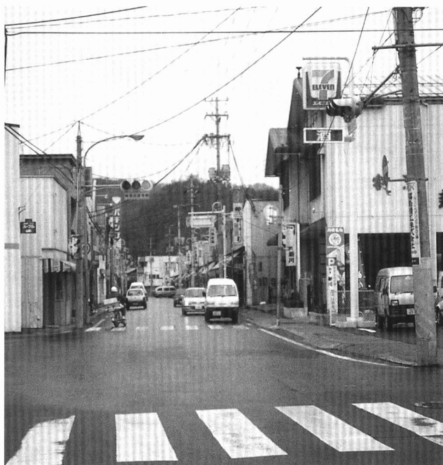
▲今の鉄炮町通り（平成10年）