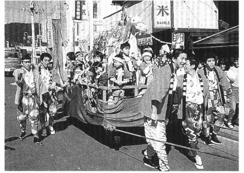
▲春日神社の秋まつり(川俣)