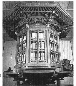
▲ずだ寺の回てりんぞう(飯坂)