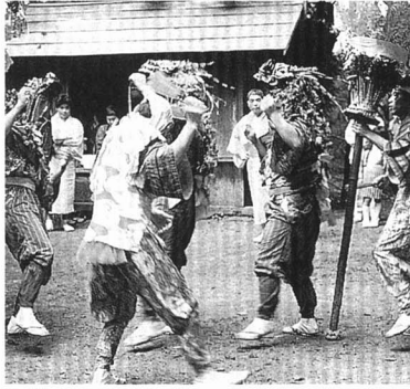
▲八まん神社ししまい(小綱木)