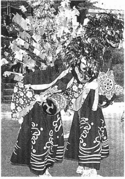
▲八坂神社ししまい(山木屋)