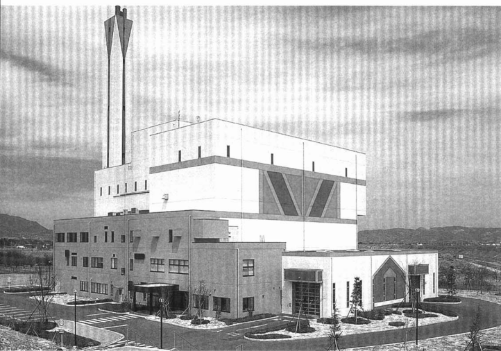
▲ 1日16時間ごみを燃やしています。(朝7時から夜11時まで)