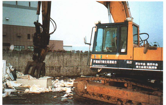
▲れいぞう庫などの粗大ごみは、機械で細かく分解されます。