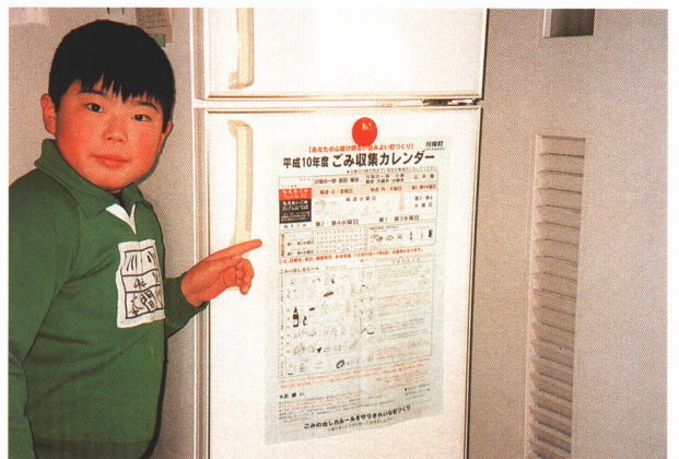
▲ごみの出し方が決められています。

ごみの種類ごとに処理する施設がちがいます。それぞれのごみを正しく処理するために、みなさんの家庭に送られる「ごみ収集カレンダー」をよく見て、決められたルールにそってごみを出してください。