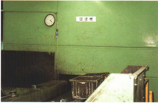
▲アルミ缶やスチール缶は、機械で選別されます。

集められたごみは、再利用できるものとそうでないものにわけられます。 再利用できないものは、うめ立て地に運ばれ、うめ立てられます。