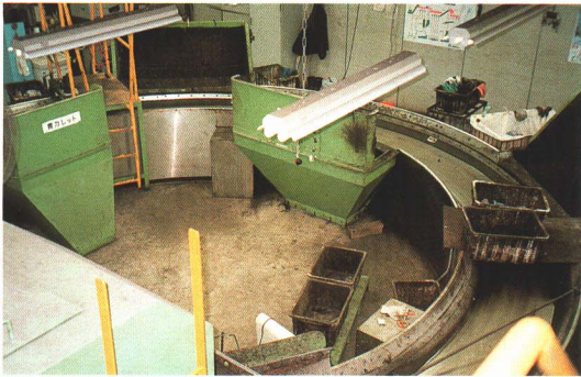
▲ガラスは、回転テーブルを使い、手作業で色別に選別されます。