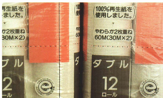
▲再生してつくられたトイレトペーパーです。