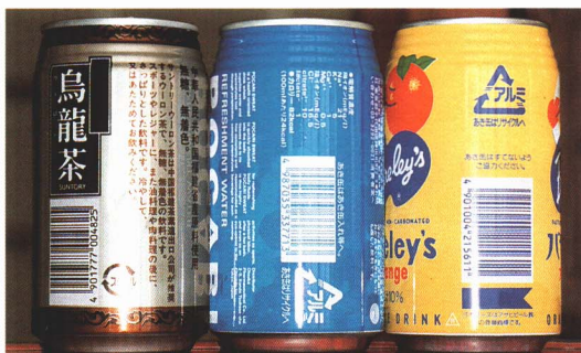
▲こんなしるしを見たことがありますか。