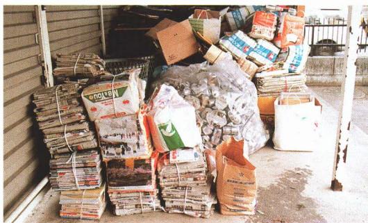
▲古新聞や段ボールを集めて、また紙をつくります。