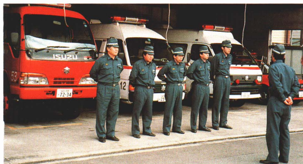
▲毎朝、仕事を確かめます。