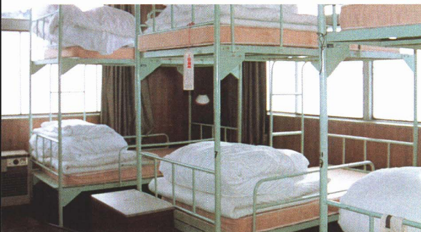
▲夜中の出動にそなえて、消防しょのベッド（仮眠室）で休みます。