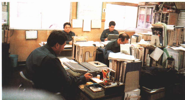
▲出動にそなえながら、ふだんは火事をふせぐための仕事をしています。