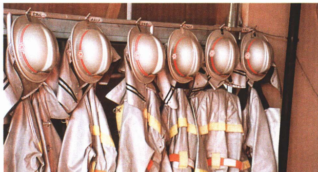
▲すぐに消防服に着がえて出動できるように、そろえておきます。