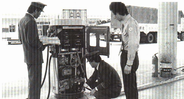
▲きげん物の検査をします。