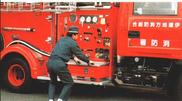
▲すぐに出動できるように、毎朝点検します。