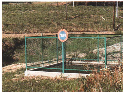
▲防火水そう (町内136か所)