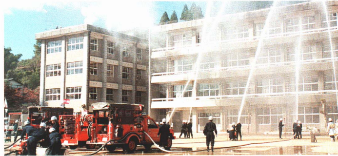
▲消火くんれんも行っています。