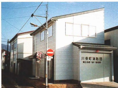
▲屯所の役わりと地区民とのコミュニケーションをはかる役わりをあわせたコミュニティ消防センター