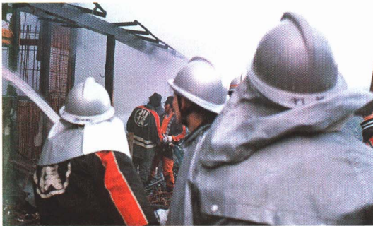
▲火事が起きると、消防署員と一しょに火を消します。