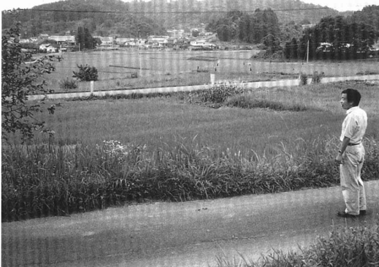
E 広町用水によってできた水田