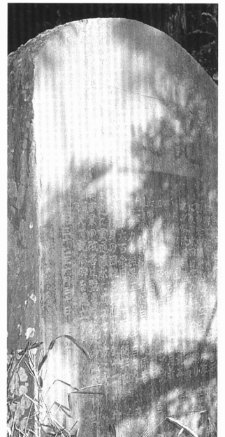
C 広町用水西門のひ