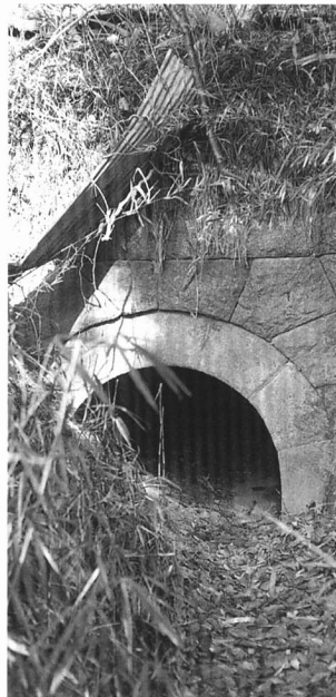
D 広町用水西門（用水の出口）