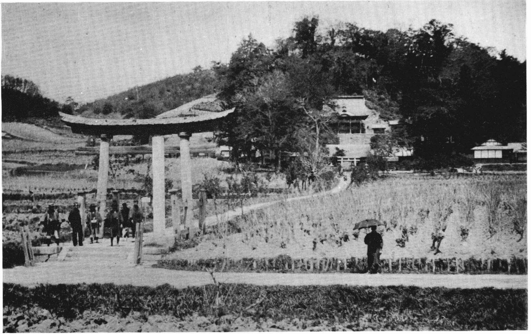
明治38年、春日神社参道