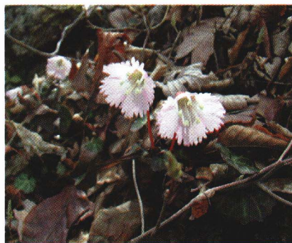
花塚山に咲く「イワウチワ」