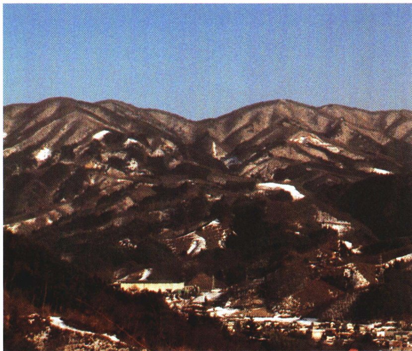
川俣の最高峰「花塚山」(鞍部の右奥に山頂がそびえる)