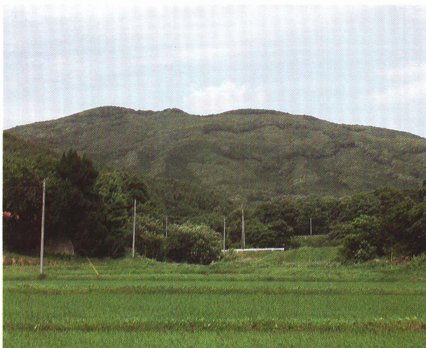
川俣町と浪江町にまたがる「高太石山」