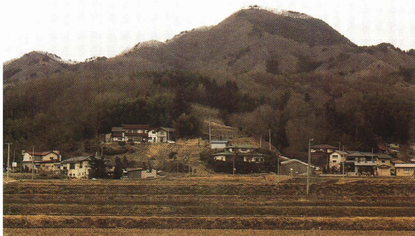
川俣町と月舘町にまたがる「女神山」