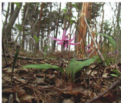
頂上付近に群生する「カタクリ」