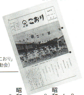
昭和48年10月の「広報こおり」(表紙は陸合小学校運動会)