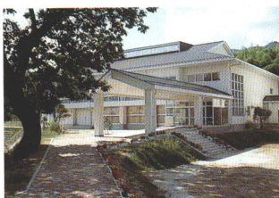
陸合小学校体育館