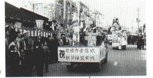
役場庁舎落成記念パレード(昭和32年)