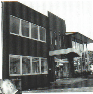
町民会館完成(昭和57年)