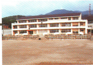
半田醸芳小学校完成(平成元年)