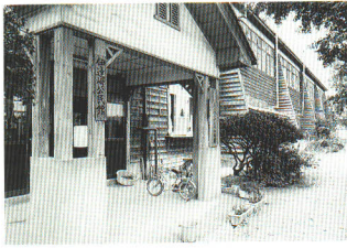
伊達崎公民館、幼稚園(昭和43年)