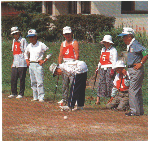
大かや園で行われているふれあいゲートボール大会

習についての支援、疾病の予防・早期発見といった体制がさらに整備される予定。また保健福祉センターを拠点として福祉センターや体育館、病院、医師会などの連携・協力体制を図ることにより、今まで以上に医療や福祉に対する対策が具体的になることは確実です。