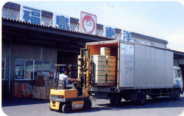
▲せい品発送のようす