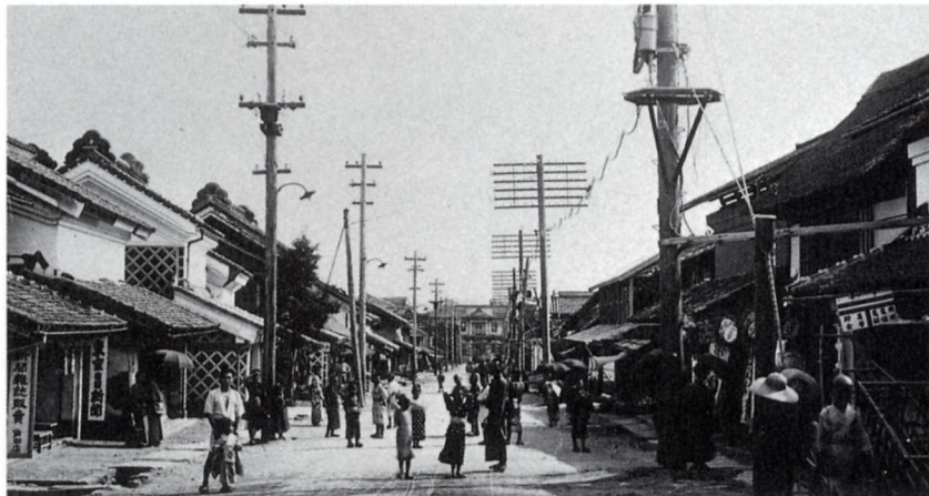
明治40年代の桑折町（80年くらい前）