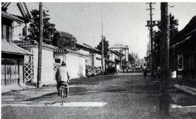
昭和20年代の本町通り（50年くらい前）