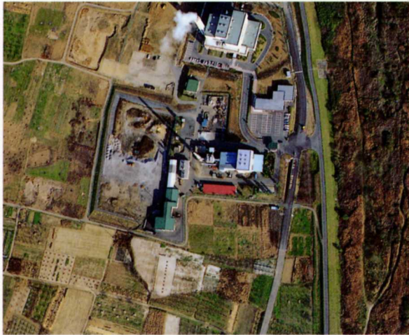
伊達地方衛生処理組合清掃センター