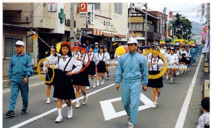
交通安全鼓笛隊パレード