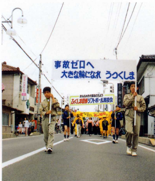
交通安全の呼びかけ