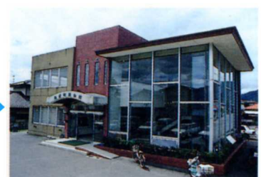
桑折公民館 (町民会館)