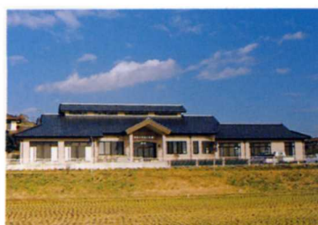
睦合ふれあい会館