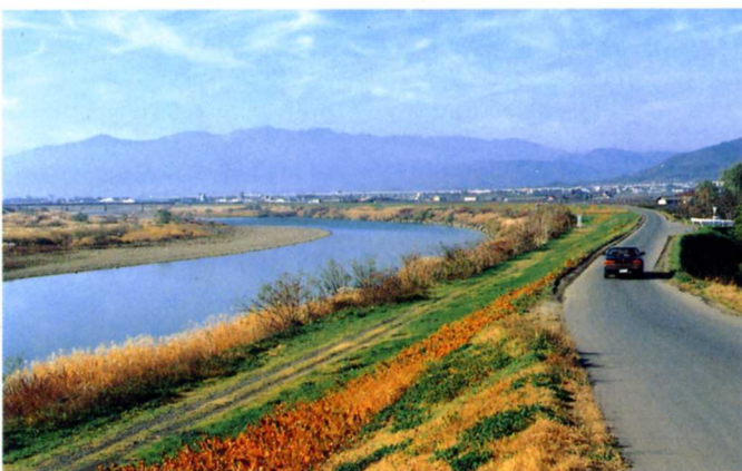
じょうぶに作り変えられた堤防