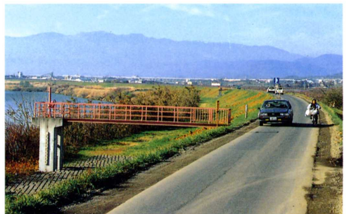
川の水量を調節する水門