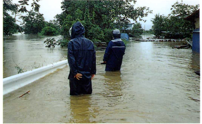
川のようになった道路