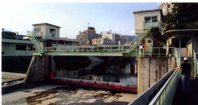
現在の下堰の取入口（飯坂町）