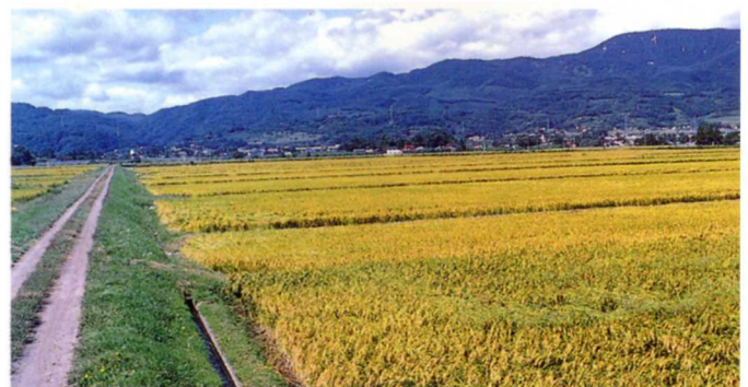
かんがいされた広々とした水田（伊達崎地区）