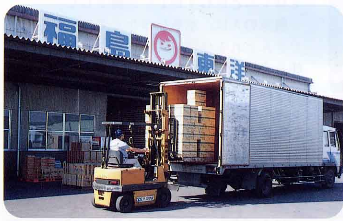
▲せい品発送のようす