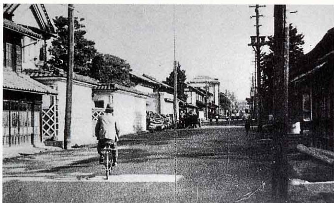
昭和20年代の本町通り（50年くらい前）