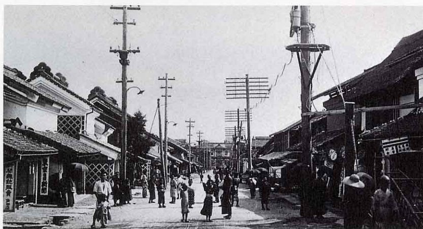
明治40年代の桑折町（80年くらい前）